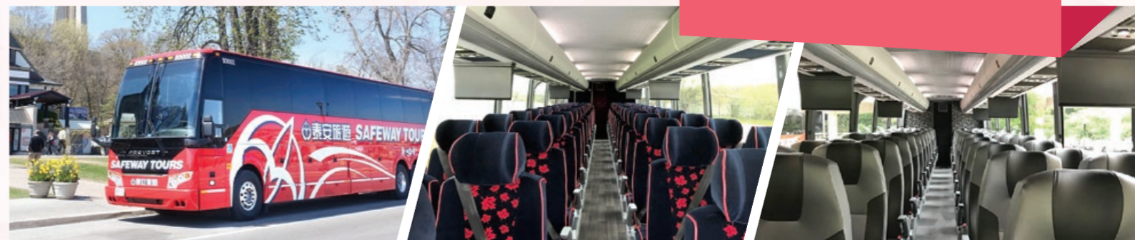
8部全新2019年巨無霸遊覽車隊現已投入服務豪華車廂設計, 為各位貴賓帶來非凡的旅遊體驗

Complimentary Airport Transfer 免費機場接送 Arrival Time 建議到達航班時間 Between 9:00 am to 9:00 pm Departure Flight 建議回程航班時間 After 8:00 pm (Domestic) After 9:00 pm (USA & International)