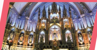
北美小巴黎—滿地可