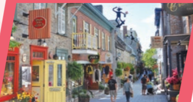
最具法式風情—魁北克市