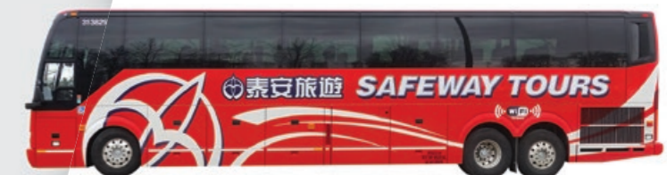
貼心安排巴士首選座位 (第1-4行)收費另計