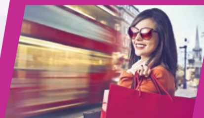
奧特萊斯名牌直銷中心

上午前往世界七大自然奇景之一的尼亞加拉大瀑布風景區。尼亞加拉大瀑布名如其實，如雷的水聲震耳欲聾，雄壯之處令人嘆為觀止。峰頂之水一瀉五十米直入谷底，洶湧激湍猶如萬馬奔騰。登上瀑布雲霄塔，俯瞰尼亞加拉大瀑布，更可欣賞著名的Imax大電影，探索神秘大瀑布。(夏季行程)乘搭霍恩布洛爾號觀光遊船穿越瀑布，傾聽瀑布狂訴其神秘之自傳，盡享古人聽濤之樂。之後前往全北美州最盛產葡萄的葡萄園釀酒廠品嚐當地名釀，除可購買由釀酒廠獨家秘制的葡萄汁外，更可到葡萄園觀賞種植葡萄過程及拍照留念。(6/7日團)晚上住宿瀑布酒店，團友可自由前往著名的賭場，或前往最熱鬧的克利夫頓山CliftonHill，乘坐觀摩天輪，更可晚餐後觀賞獨特的瀑布夜景。